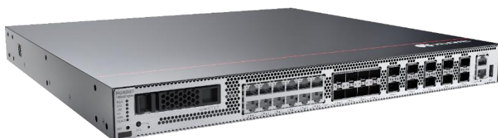
Figure 2-7 Appearance and auxiliary materials of the USG6525F, USG6555F, USG6565F, USG6585F, USG6615F, USG6625F